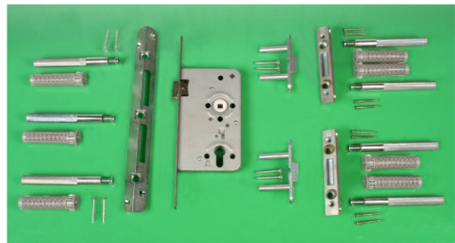
Beispiel eines (Tür-)Nachrüstsets

Auch (Holz-) Türen können mit einem Sicherungssystem im Falz nachgerüstet werden. Zusätzlich ist ein einbruchhemmender Schutzbeschlag und Profilzylinder erforderlich.